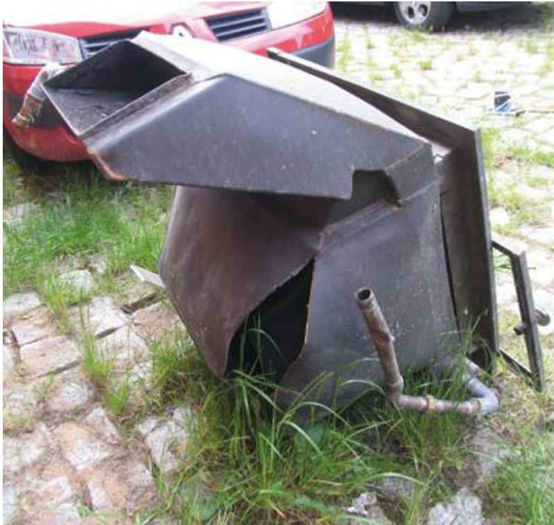
Bild 7: Die Schweißnaht des Kessels riss an der hinteren Ecke auf einer Länge von mehreren Dezimetern auf.