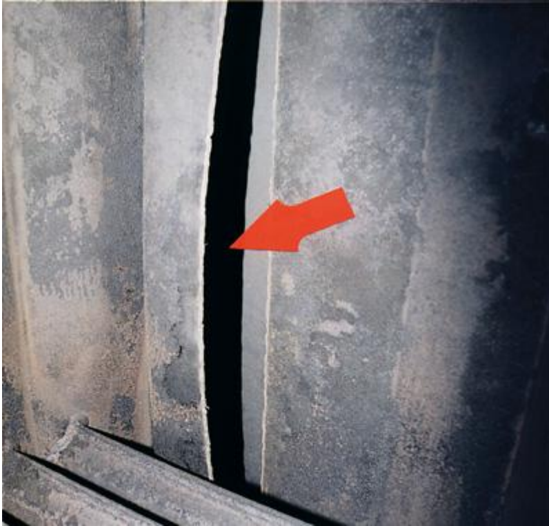
Bild 2: An dieser Stelle im Brennraum riss eine Schweißnaht des Kessels.

Bei der Explosion, die sich im Wohnzimmer ereignete, riss sich der Kaminkessel aus seiner Verankerung, durchschlug die Holzterrasse, die ins OG führte und blieb im Hausflur liegen. Im gesamten Haus fiel das Licht aus und fast wäre die Tochter der Mieterin aufgrund der zerstörten Treppe vom Obergeschoss in das Treppenhaus gestürzt. Im Wohnzimmer wurden an den dem Kaminkessel gegenüberliegenden Wänden der Eisenrahmen der Kesseltür, Glassplitter, Holzteile mit Nägeln aus dem Brennraum sowie Ablaufspuren von dem zur Explosionszeit über 100°C heißen Kesselwasser gefunden.